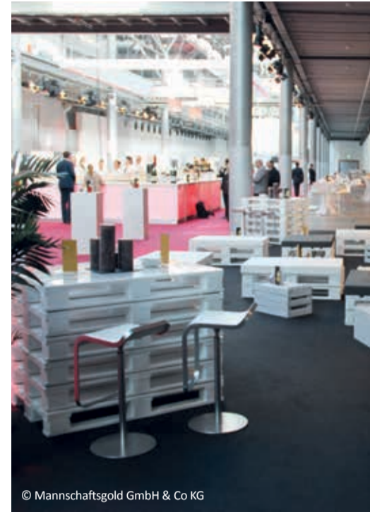
© Mannschaftsgold GmbH & Co KG

Wir machen Ihre Veranstaltung zu einem unvergesslichen und emotionalen Erlebnis – entspannt für Sie und in bleibender Erinnerung bei Gästen und Teilnehmern.