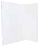
42 100 Stellwand „Klick“ HPL beschichtet, B 100 | H 250