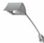
68 130 Langarmstrahler Halogen, Silber, 150 W L 30