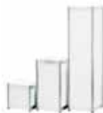
42 400 Säulenpodeste Octanorm Systembau, Aluminiumrahmen, Ausfuchung weiß, verschiedene Größen auf Anfrage